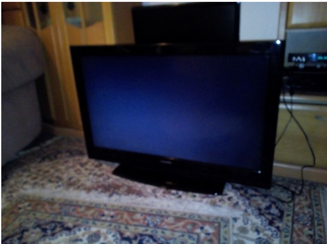
Bild. 2 (Nach dem Ausfall grau leuchtender Bildschirm –hier sieht man aber leider blau)